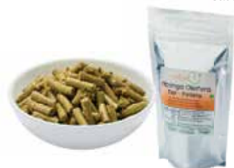
Moringa peletky pro zvířátka: 200 g / 1000 g

Granulát pro zvířata ze 100 % čisté Moringy oleiferu z ořezu listů, řapíků a větviček vede při pravidelném užívání k postupnému zvyšování vitality a harmonizaci těla a myslí vašeho domácího mazlíčka. Příspěvek do krmiva. Syrová potravina, veganská, bezlepková.