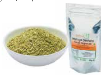
Moringa granulát pro zvířátka: 100 g / 500 g